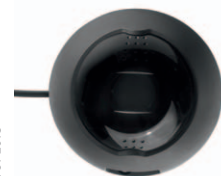
Handenhet Interlock® 7000