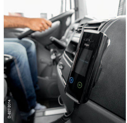
Användning i lastbilar