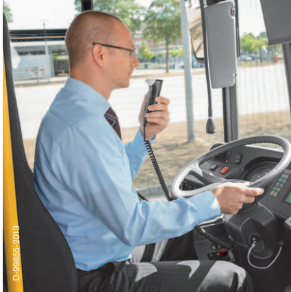
Användning i bussar

förebyggande- och villkorlig verksamhet, och har en särställning när det gäller kvalitet och service. Interlock 7000 är resultatet av all denna kunskap. Välkommen till familjen!