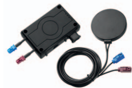
Kamera Interlock® 7000